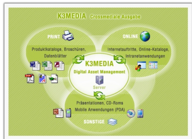
Aufbau K3MEDIA: Crossmediale Ausgabe in den Bereichen Print, Online, Sonstige.

Große Medienbestände können mit K3MEDIA optimal verwaltet und dauerhaft zugänglich und nutzbar gemacht werden. Ein schnelles Auffinden von benötigten Daten und Informationen ist somit gewährleistet.